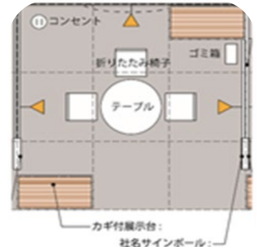
基本装飾付属備品配置図 (イメージ)