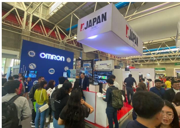
ITM2023 ジャパン・パビリオンの様子