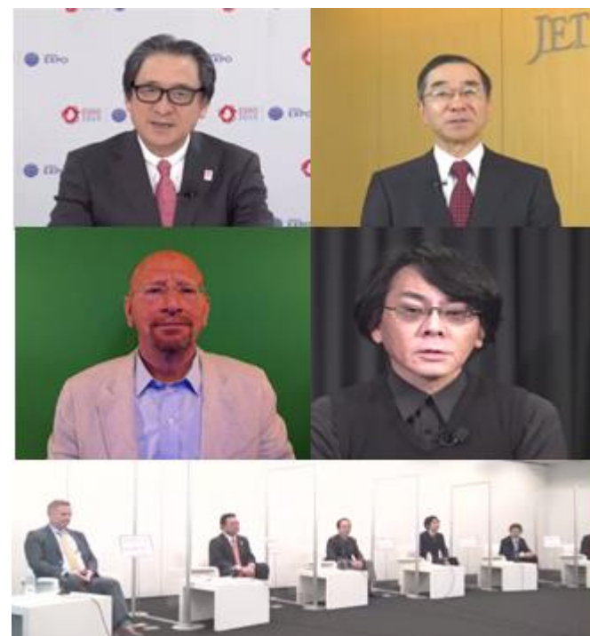
ジェトロ・万博協会主催 オンラインシンポジウムの様子

ジェトロは自由で公正なルールに基づく貿易を推進する我が国の通商政策に沿い、持続可能な開発目標（SDGs）も踏まえながら、貿易の利益を広く享受する包摂性（インクルーシブネス）を高める観点から、貿易・投資振興機関として自由貿易の経済的恩恵を積極的に発信するとともに、とりわけ中小・地域の企業などに海外とのビジネスに参加する機会を提供します。