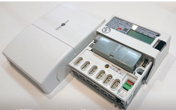
共同開発したスマートメーター（子メーター）

両社は、2020年に互いにアイデアと技術を提供し合い、新たな太陽光発電用のスマートメーターを共同で開発。横浜から、日本における太陽光発電の裾野を広げようと取り組んでいます。