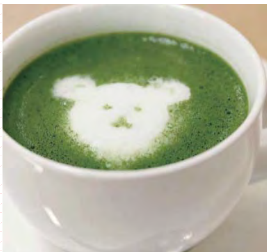
Порошковый зеленый чай "маття", напиток "маття-латтэ" ("маття" с молоком)

В последнее время в большинстве стран мира зеленый чай относят к так называемым «суперфудам». Все больше людей начинает пить зеленый чай не только для удовольствия, но и для укрепления здоровья. Наша компания расположена в префектуре, выращивающей собственный чай, и рада предложить чайную продукцию высочайшего качества по доступным ценам. Компания успешно прошла сертификацию FSSC22000 (Food Safety System Certification), благодаря чему мы можем гарантировать не только превосходный вкус, но и полную безопасность нашей продукции.