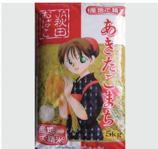
Рис "Акита-комати" (полированный)

Префектура Акита, расположенная на севере Японского архипелага и омываемая Японским морем, известна своими снежными зимами. Под влиянием потоков холодного воздуха со стороны Сибири здесь часто бывают обильные снегопады. Глубокие сугробы и талые грунтовые воды щедро увлажняют заливные поля, на которых здесь выращивается самый любимый в Японии сорт риса «Акита-комати». А благодаря влажному лету на полях префектуры Акита вырастает соя высочайшего качества, из которой по традиционной технологии изготавливают бобовую пасту мисо и соевый соус с особым, характерным только для этой местности вкусом.