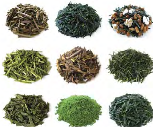
Зеленый чай ("сэнтя", порошок "сэнтя", зеленый чай с добавлением бурого риса "гэнмайтя", запеченный зеленый чай "ходзитя", чай из стеблей чайного куста "кукитя".

Как и для элитного чая «гёкуро», для порошкового чая «маття» молодые листья чайных кустов, выращенных под навесами, собирают вручную и обрабатывают паром. Затем листья высушивают в расправленном виде и растирают в порошок в каменной ступе. Заваренный горячей водой «маття» пьют не процеживая. Благодаря высокой концентрации чайных листьев этот напиток обладает богатым ароматом и насыщен витамином E, бета - каротином, клетчаткой и другими нерастворимыми полезными веществами, которые не входят в состав обычного процеженного чая.