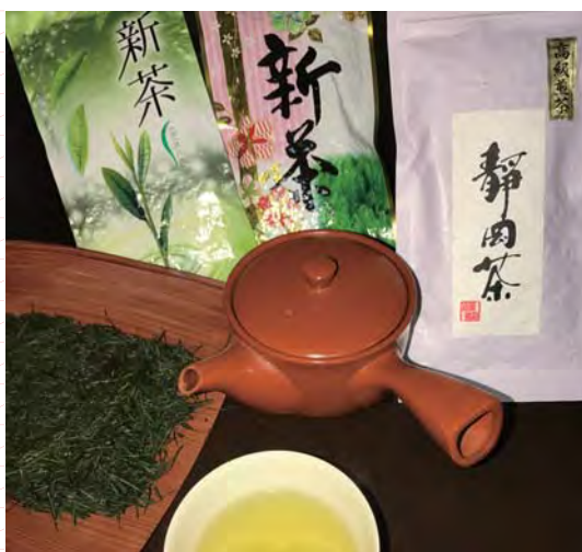
Японский зеленый чай

ООО «ЭВЕР ГРИН» специализируется на экспорте зеленого чая, который является одной из основ национальной пищевой культуры Японии. Компания осуществляет поставки элитного чая «гёкуро» (что в переводе с японского означает «жемчужная роса»), а также чаев «сэнтя» и «бантя», запеченного зеленого чая «ходзита» и нескольких видов завоевавшего популярность за пределами Японии порошкового зеленого чая «маття». Помимо чая компания предлагает ряд сопутствующих товаров: леденцы «тямэ» и фасолевый мармелад «тяёкан» с добавлением зеленого чая, а также чайники и другие чайные принадлежности.