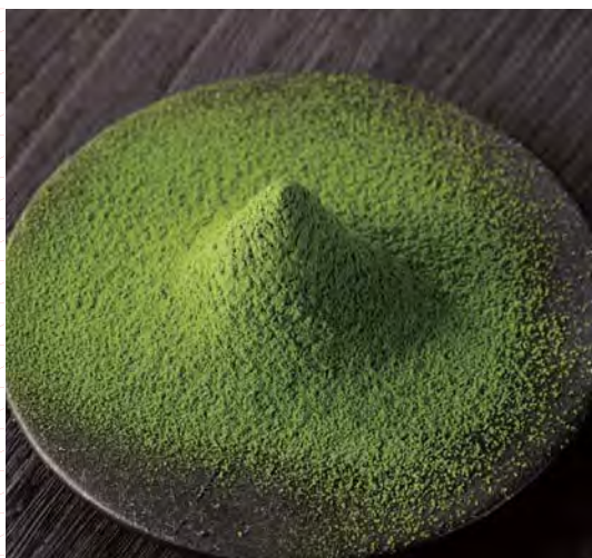
Зеленый порошок чай "маття", выращенный на органических удобрениях

Международный отдел компании работает на постоянной основе и осуществляет экспорт в значительных объемах. Мы можем обеспечить соответствие нашей продукции официальным стандартам, действующим в каждой из стран-импортеров, благодаря хорошо отлаженным процедурам сертификации (сертификация отсутствия загрязнения пестицидами, сертификация радиационной безопасности, международная сертификация органической продукции).