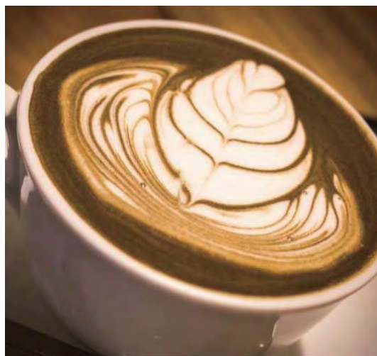
Напиток "ходзита-латтэ" (запечённый зеленый чай "ходзита" с молоком)

Мы рады предложить вам «маття» и «маття-латтэ», изготовленные на новейшем оборудовании повышенной надежности. Поскольку поставка сырья для чая «маття» осуществляется напрямую с места его сбора, мы имеем возможность устанавливать наши цены ниже рыночной стоимости. «Маття» можно не только заваривать в виде чая, но и использовать при приготовлении шоколада и других кондитерских изделий, а также добавлять в разнообразные напитки (например, в смузи). «Маття-латтэ», который производит наша компания, является готовым напитком. Мы можем предоставить его владельцам сетевых кофеен и ресторанов в оптовых объемах.