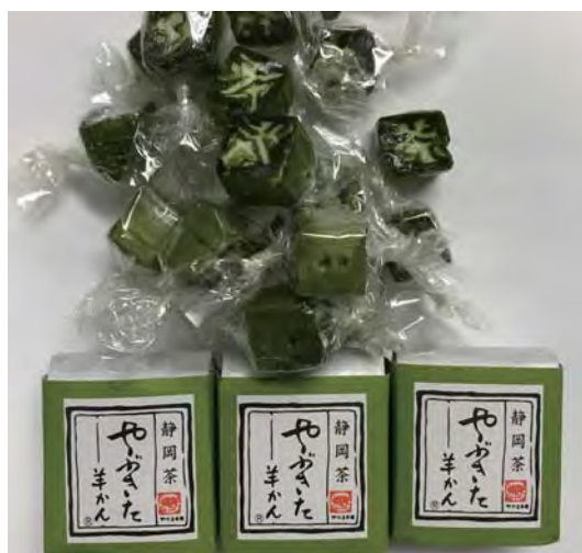
Леденцы и фасолевый мармелад с добавлением зеленого чая

Зеленый чай – это самый популярный в Японии напиток. Уникальная японская технология чайного производства включает обработку свежих чайных листьев паром. Этот метод помогает предотвратить окисление и сохранить яркий зеленый цвет и насыщенный аромат. В последние годы зеленый чай завоевал мировую популярность в качестве напитка, который ощелачивает организм, способствуя его оздоровлению, а также эффективен для профилактики возрастных заболеваний. По этой причине объем экспорта зеленого чая стремительно увеличивается.