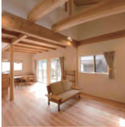
Wooden Structure & Interior

일본내에서도 손꼽히는 임산면적을 자랑하는 기후현의 히다지역에서 자란 나무를 사용하고 있습니다. 주문생산을 통해 여러분들의 주거 생활에 꼭 맞는 목조주택을 지어 드리겠습니다.