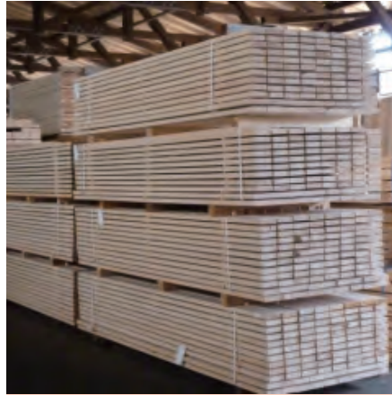
hinoki wall panel

다양한 종류의 용도로 가공할 수 있도록 일부러 쪽을 완성하지 않고 가공하지 않은채, 상품화 했습니다.