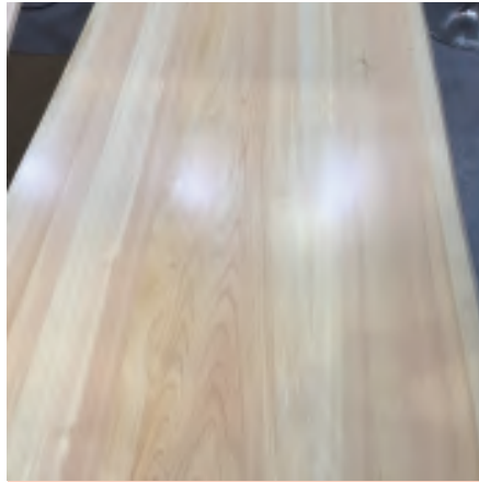
Natural Wood Top Board

주거공간의 창에 붙이는 새로운 감각의 히노끼 블라인드입니다. 히노끼 향으로 방전체에 고급감을 연출합니다.