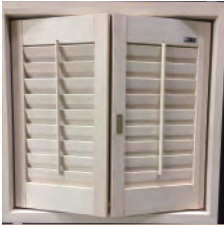
Japanese HINOKI LOUVER SHUTTER