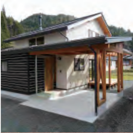
Order Made Wooden House