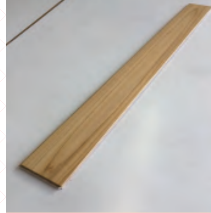
Compressed flooring material