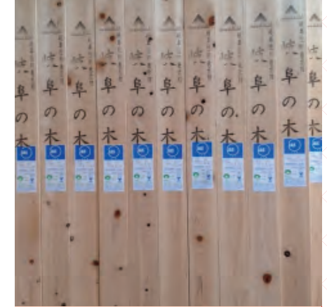
Post And Timber

기후의 삼나무 · 히노끼를 압밀한 플로링(내장재)입니다. 아름다운 나뭇결이 돋보이는 플로링입니다.