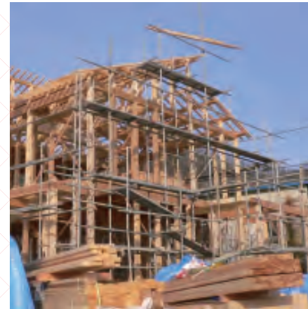
Wooden Framed House 중목구조 목조주택

예로부터 나무의 문화가 발달한 기후현에서는, 중목구조 공법의 목조주택 건설이 번성했습니다. 복잡한 수작업을 기계화한 프리컷기술로 비용의 절감, 공기의단축, 정밀한 건축을 실현했습니다.