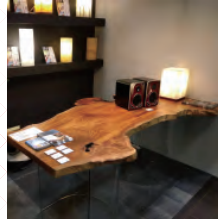
Pure solid wood board 우드슬랩

원목그대로 절삭한 우드슬랩(떡판)을 일본의 장인이 장인정신을 가지고 가공했습니다. 베이직한 오일도장부터 색이 선명한 착색도장 까지 다양하게 취급하고있습니다.