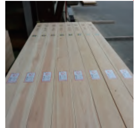
The Japanese Cypress of Gifu 기후의 히노끼

예로부터 나무의 문화가 발달한 기후현에서는, 중목구조 공법의 목조주택 건설이 번성했습니다. 복잡한 수작업을 기계화한 프리컷기술로 비용의 절감, 공기의단축, 정밀한 건축을 실현했습니다.