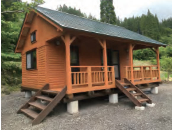
HINOKI LOG HOUSE 히노끼 로그하우스

벽 등은 인공건조가 끝난 상태이므로 프리컷(Precut) 후의 결함과 균열이 매우 적어, 누구라도 간단히 조립 가능한 통나무집입니다. 토대(삼나무)는 방부, 방의, 방충 대응이 가능한 상태입니다. 골조류는 105mm 각의 삼나무재, 벽은 두께100mm X 높이105mm의 히노끼재 입니다.