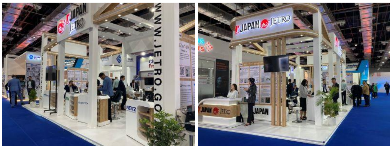
2023年Africa Health ExConジャパン・ブースの様子 ※過去の展示会のものであり今回のデザインとは異なります。