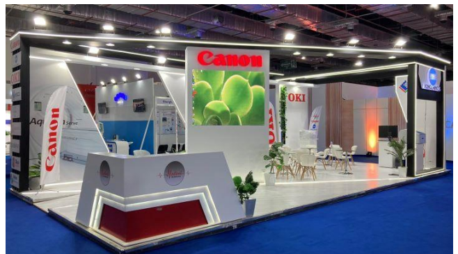
Africa Health ExCon 2023の様子