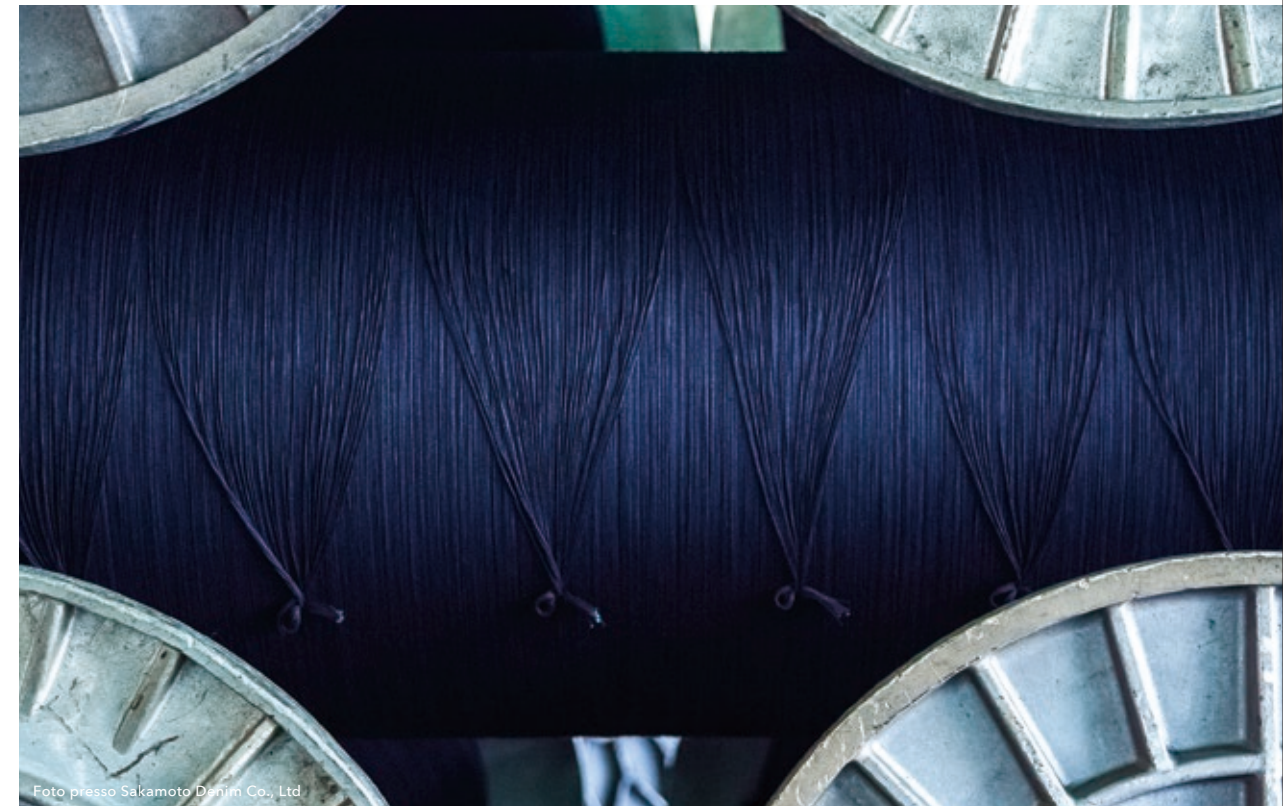
Foto presso Sakamoto Denim Co., Ltd.

Alcune aziende seguono un percorso in cui i professionisti si connettono tra loro, avvantaggiandosi dei punti di forza reciproci in ogni fase della produzione, come la filatura, la tintura, la tessitura, il cucito e la lavorazione, e tutta questa “produzione specializzata e collaborativa” crea un prodotto unico. Altre aziende gestiscono processi di produzione multipli e questa “produzione integrata” consente loro di perseguire il proprio denim ideale e, allo stesso tempo, di accumulare il proprio know-how interno. Indipendentemente dalle dimensioni, ciascuna azienda aspira a produrre il miglior denim nel proprio stile e ha visto l'evoluzione di questa regione come una regione di produzione di denim.