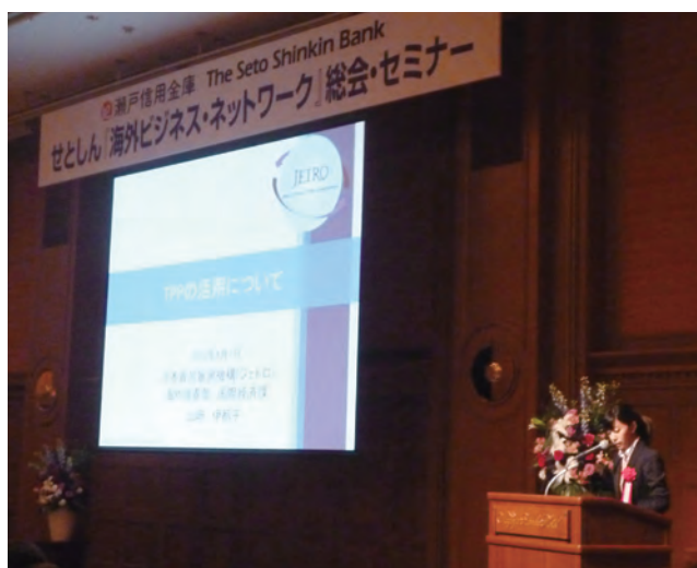
2016年4月7日せとしん『海外ビジネス・ネットワーク総会及びセミナー』の様子

本ネットワークでは、年に数回ネットワーク会を開催しているほか、外部講師による各種セミナー、海外ミッションの企画・実施、コンサルティング会社や公的機関の紹介など、様々な活動を行っています。