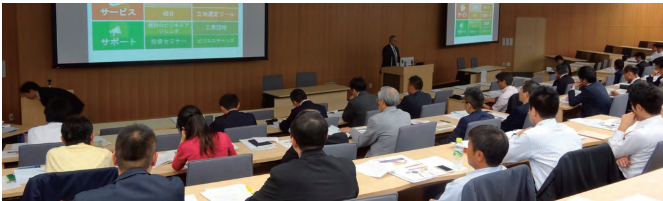
2015年10月15日開催 メキシコ投資セミナーの様子

瀬戸信用金庫は、ジェトロ名古屋との連携事業として、セミナーを共催しています。これまでには、メキシコのビジネス環境や、経済連携協定の活用など、皆様のご関心が高い国や分野をテーマに取り上げているほか、海外販路開拓に必要な基礎知識や実務について解説するセミナーも開催しております。