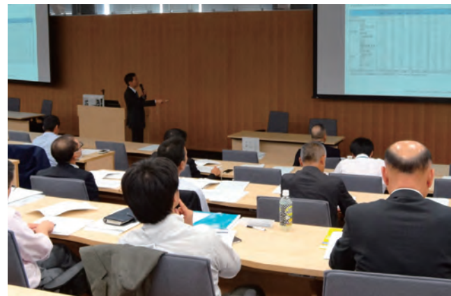
2015年10月15日開催 メキシコ投資セミナーの様子

今後も、ジェトロとの連携のもと、当地企業を取り巻く世界経済の情勢に応じ、ニーズに沿った情報提供を行ってまいります。