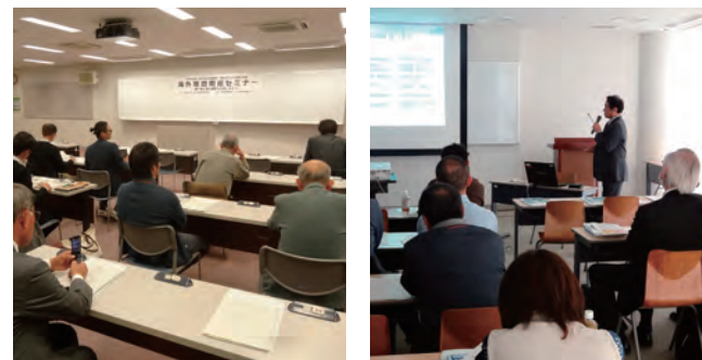
2015年11月26日、12月10日開催 海外販路開拓セミナーの様子

第2回目はジェトロ名古屋のアドバイザーから、輸出の進め方など貿易実務についての講演や、当金庫職員による資金決済