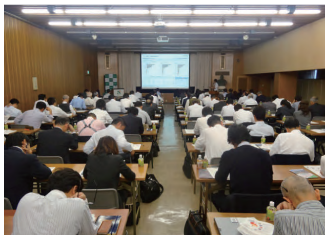
2016年11月15日開催ベトナムセミナーの様子

※セミナーの連携とは、ジェトロ名古屋に共催、後援、講師派遣を受けることを指します。