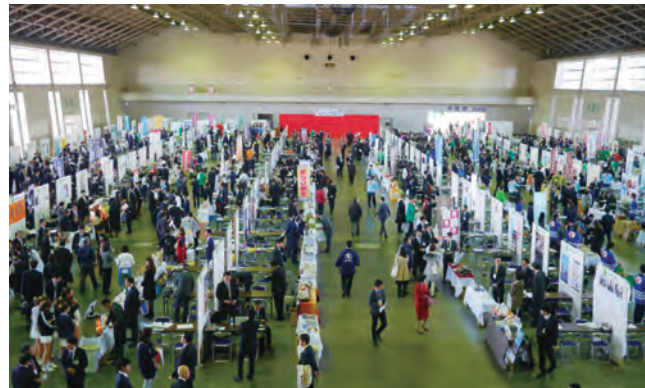
2017年3月開催 第2回「食」と「農」の大商談会の様子

2017年3月に開催された第2回あいち・じもと農林漁業成長応援「食」と「農」の大商談会では、ジェトロ名古屋の職員を講師として迎え、食品の輸出に関するセミナーを開催しました。