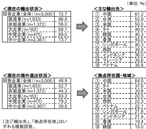
図表1： 回答企業（3,005社）のプロフィール