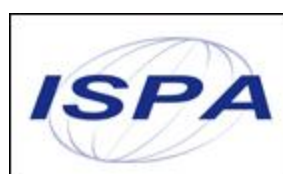
図3: ISPA UK ロゴマーク

インターネット業界の競争、自主規制並びに発展を目的とした業界団体として、1995年に Internet Services Providers' Association (ISPA UK)が設立された。ISPAの会員はISPAの行動規範『ISPA UK Code of Practice』を遵守する義務を負うとともに、公正な商慣習の証としてISPA UKのロゴマークを掲示することを許される。