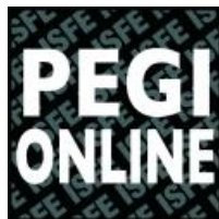
図 2: PEGI Online Logo

オンラインプレイが可能なビデオゲームが PEGI Online Safety Code を遵守していると認められた場合、ライセンスの証として PEGI Online Logo がパッケージ等に掲載される。