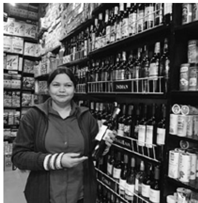
スーパーの棚に陳列されたワイン

まず立ちどころなのが関税だ。現状酒類の輸入にはビールで100%、それ以外で150%の高額な基本関税がかかる。そこにその他の税金や国内流通上の各種マージンが課され、輸入酒の価格は高額となる。訪印の際、現地の友人に、空港の免税店で輸入物ウイスキーを買ってきてほしいと頼まれたことがあった。ここからも、高い税金が購入のハードルを上げている様子がうかがえる。都市部の日本料理店で提供される日本酒などの価格は、店や銘柄にもよるが、720ミリリットルで平均1万円以上、