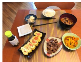
参加者による日本食の調理事例