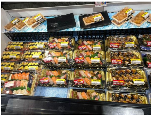
当地小売店の店頭（Don Don Donki）