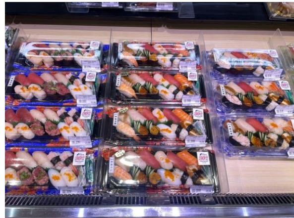
当地小売店の店頭（明治屋）