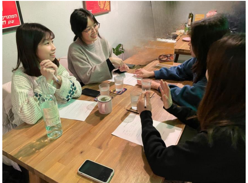
最新の食情報は口コミとネットで入手する