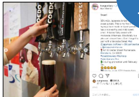
インフルエンサー投稿