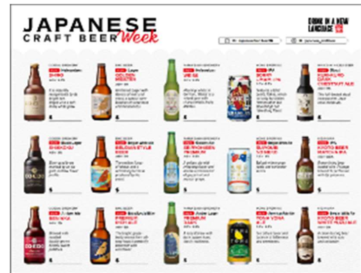
キャンペーンメニュー例