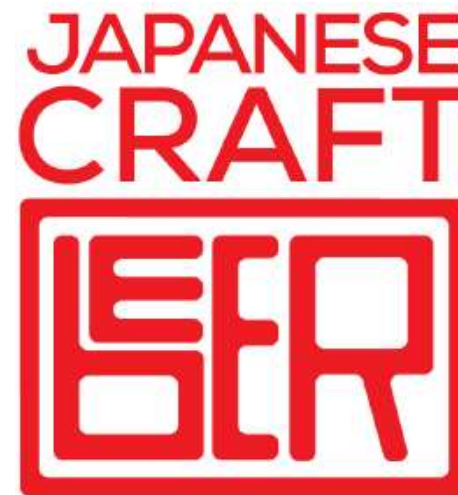
日本産クラフトビールロゴ（2019年度も継続） ハンコ（印章）からインスピレーションを得て制作しました