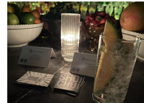
【提供された焼酎カクテル】