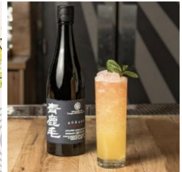
【キャンペーンで提供されたメニューとカクテル例】