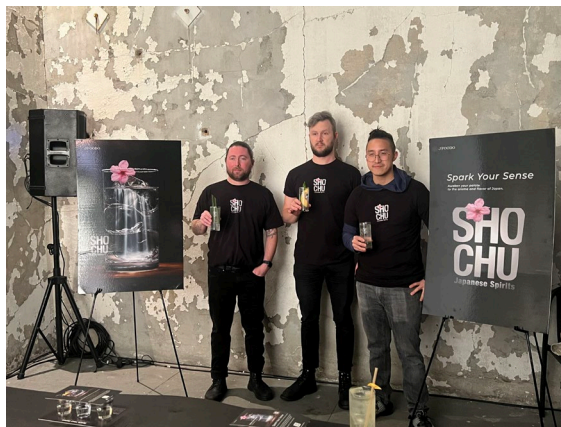
【アンバサダーミクソロジストによるトークセッション】