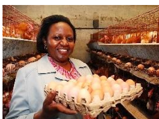
畜産農家支援ローン