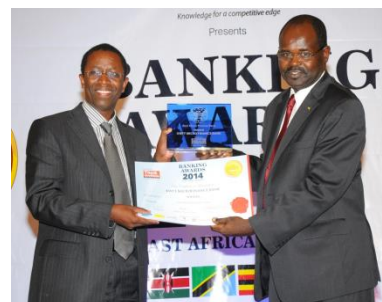
東アフリカ「BANKING AWARDS 2014」においてベスト・マイクロファイナンス賞を受賞

女性に特化したサービスを行っていることがKWFTを業界の中で独自の存在としている。KWFTは土地などの担保がなくても融資を受けられるなど、一般の銀行に比べてローンの借り手に優しいのが特徴。女性は家族や自分のエンパワメントに資金を使うことに積極的であり、社会・経済を牽引していく力がある。これに着目したことがKWFTの成功につながっている。