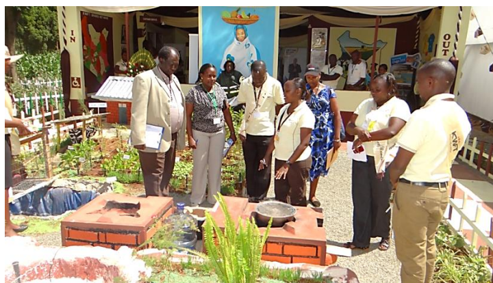
KWFTによる、かまど等の展示。KWFTのローン利用により購入に繋がる。