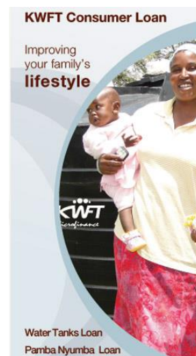
生活改善のためのローン商品： 給水タンク・ローン