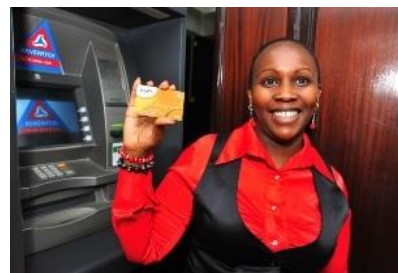
銀行キャッシュカードとATM(ATMは全国に800台以上設置、24時間年中無休)