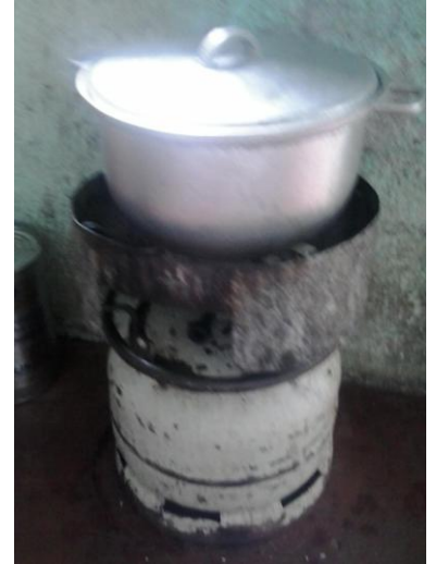
調理用ガスコンロ