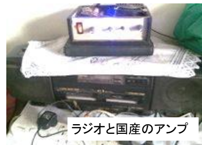
ラジオと国産のアンプ