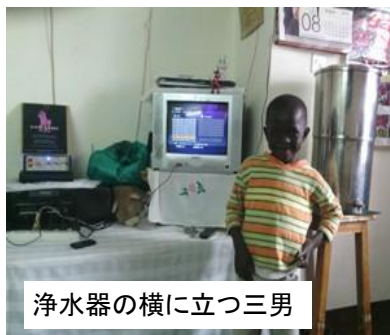
浄水器の横に立つ三男