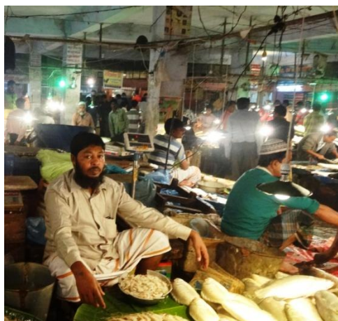
市場内のイスラムさんの店