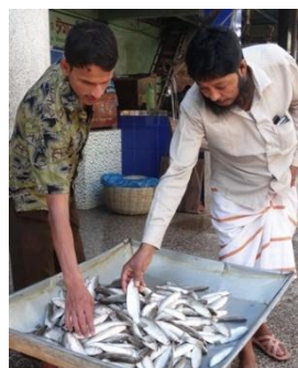
魚河岸での魚の品定め