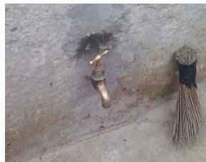
敷地内に引かれた水道