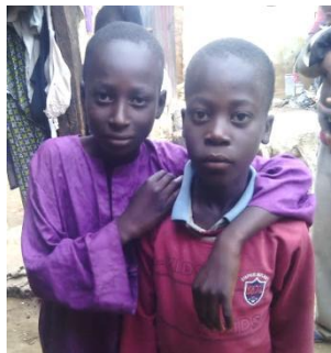
長男(右)と同居中の甥(左)

長女がまだ幼いので、買い物や家事は長男が手伝っている。 現在乳児の四男は、母乳で育てている。