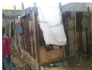
扉の代わりに袋を下げた正門