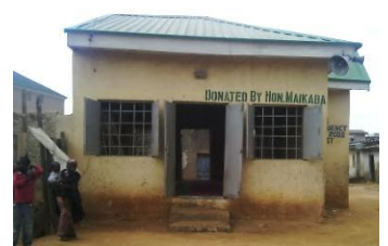
自宅の隣にあるモスク (左側に自宅敷地の正門が見える)