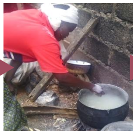
丸めたものを茹でる