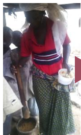
豆とスパイスを共にすり潰す