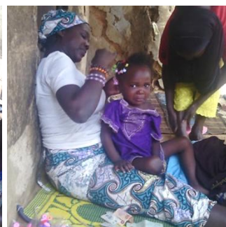
長女の髪を編んでくれている近所の人