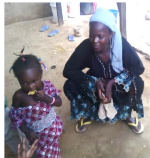
サルマさんと長女