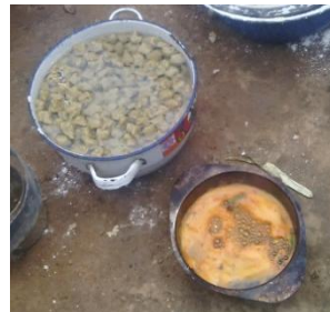
茹で上がったダンウェイク(左)とオイルのソース(右)