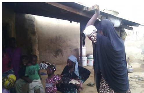
訪ねてきた近所の人