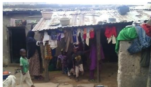
母屋のバルコニーの軒下

バルコニーにブリキのひさが付いており、家事や食事、子供たちの遊び場、そして寛ぎの場となっている。 近所の人たちが遊びに来たときも、バルコニーの軒下で談笑している。