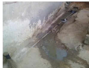
トイレ(右写真にある穴)は浴場と同じ場所にあり、排水を外に出す溝が壁際に掘られている。