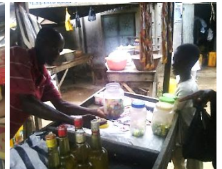
長男と一緒に市場で買い物をする様子