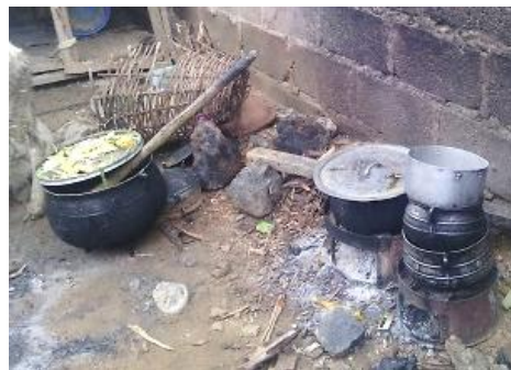
調理場に置いてある五徳(右2つ)