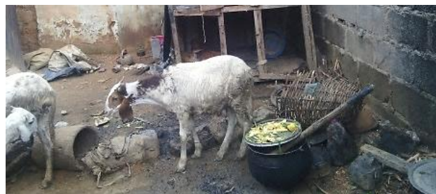
羊も調理場の横で食事