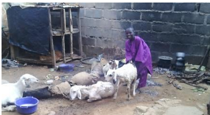
ヤギ小屋(左奥)と調理場(右奥)