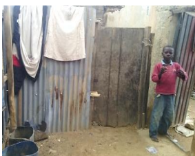
敷地内に入る木製の入口 (夜は南京錠を掛ける)