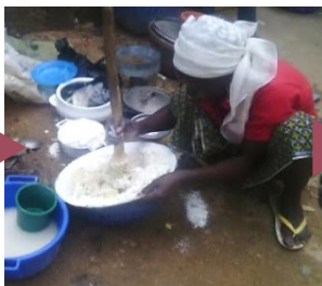
木ベラで練り、ボール状に丸める