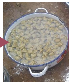
茹で上がったダンウェイクに、唐辛子などのスパイスをすり潰しオイルで煮込んだソースをかける