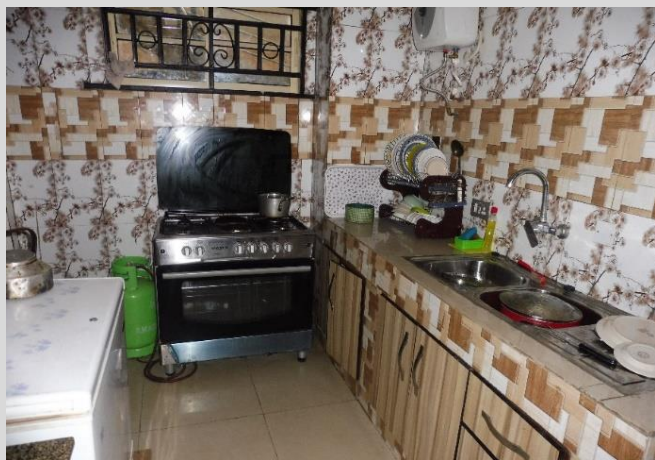
キッチン（コンロは4口ガス、電気バーナー付き）

外装も内装もタイル作りの3ベッドルームの高級アパート。賃貸で4年前より居住。 駐車スペースも豊富。車は2台所有。