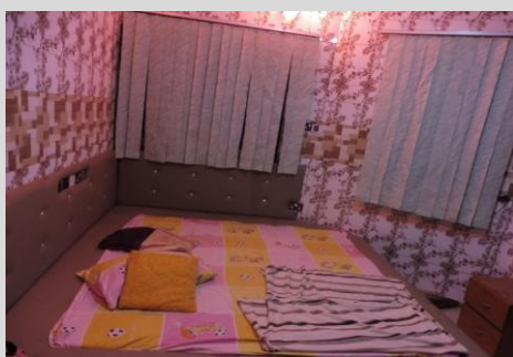
夫人寝室（キングサイズベッド）