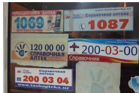
コールセンターへの連絡先

医薬品のインターネット販売はまだ行われていない。シティーコールセンターが情報源となり、消費者は、医薬品や薬局の情報を確認することができる。いくつかのコールセンターでは、特定の医薬品情報(薬局とその電話番号)が検索出来るウェブサイトを持っている。www.1401919.uz