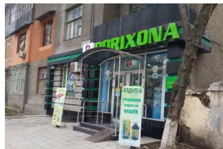
薬局 B 店頭