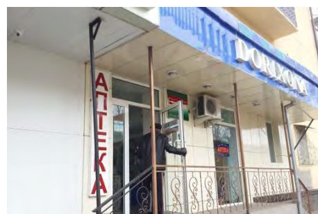
薬局 A 店頭

高価格から低価格の医薬品、OTC医薬品、化粧品、日用品などを販売している。向精神薬、精神活性物質他、特殊免許を必要とする医薬品等は取り扱っていない。