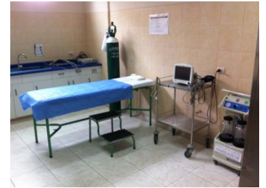
救急科治療室。心電図モニター・酸素吸入器など公立診療所として充実