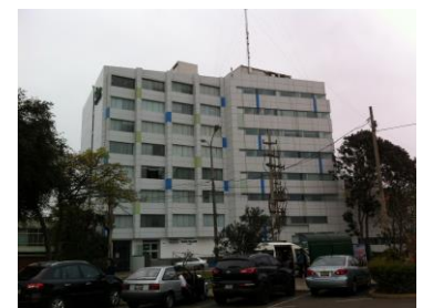
サン・フェリペ病院