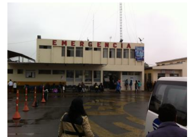
救急病棟入口の外観。病棟裏側は細い廊下や階段があり、患者や医療スタッフの移動経路の設計はよくない。