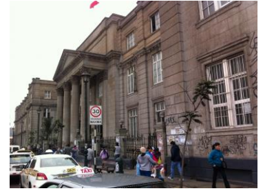
アルonsoビスポ・ロアイサ病院

※注：一次医療機関：プライマリ・ヘルスケアを担う。正規医療従事者不在のものから総合診療科、小児科、産婦人科、病理検査を提供し、入院施設を備えるものまで幅広い。 二次医療機関：地域医療の中核病院。少なくとも総合診療科、内科、外科、小児科、産婦人科、麻酔科、病理検査を提供し、救急医療、入院医療、手術、画像診断に対応する。 三次医療機関：全国リファラル体制の中核をなす総合病院。すべての診療科、病理検査、救急医療、入院医療、画像診断を提供し、各診療科の集中治療室等を備え、高度医療研修が可能。