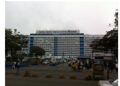
エドゥアルド・レバグリアティ病院