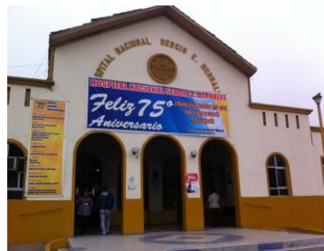
病院正門入口。広大な敷地に複数の二階建ての病棟を回廊で連結した設計。