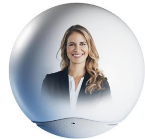
Zeppi社が開発中の製品

ヘリウムガスで浮遊しているため、ドローンのように大きな音を出したり、浮遊のためのエネルギーを必要としないことが同社の製品の特徴だ。