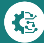
AI & Machine Learning