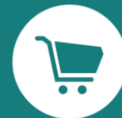
Retail & Commerce