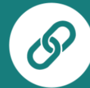
Crypto & Blockchain