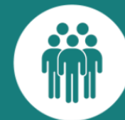
Talent & Diversity