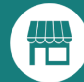
The Small Business Economy