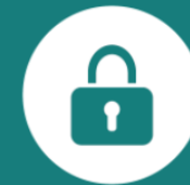
Identity & Privacy