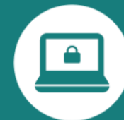
Transforming Tech for the New Normal