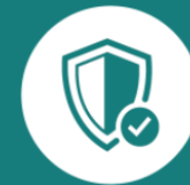
Growing & Protecting Wealth