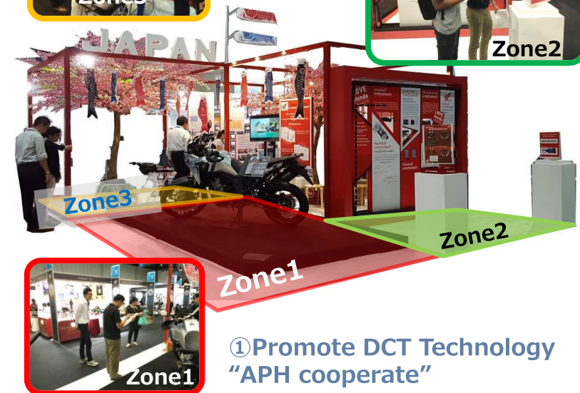
① Promote DCT Technology "APH cooperate"