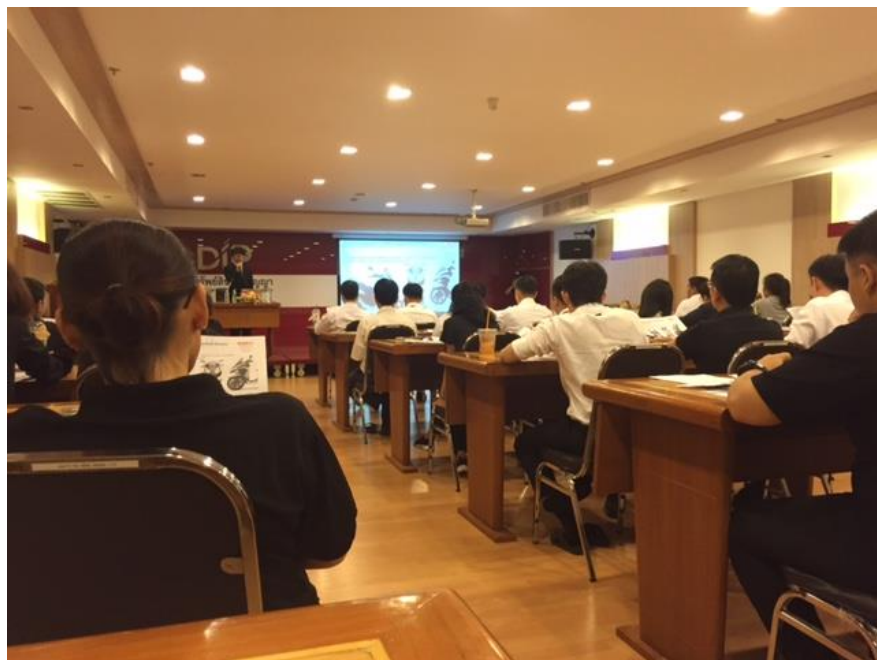
会議室での講義の様子