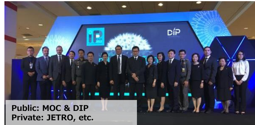
Public: MOC & DIP Private: JETRO, etc.