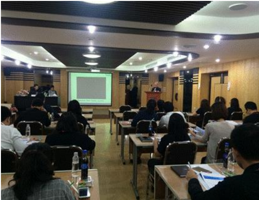
会議室での講義の様子