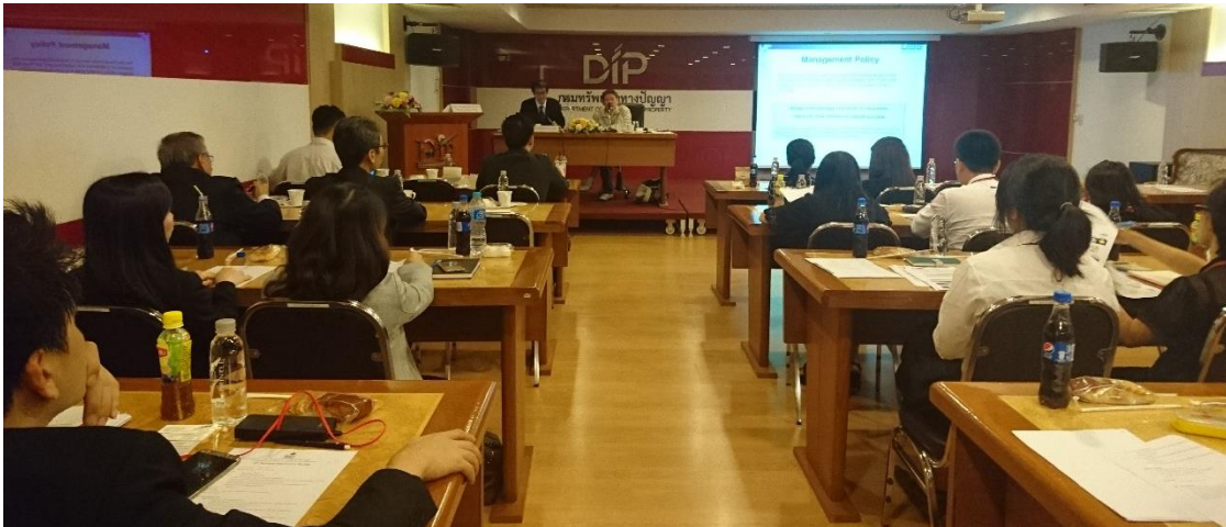
会議室での講義の様子

新人審査官からベテラン審査官まで 化学系の審査官がそろった。 案件説明に関する質問も多く出た