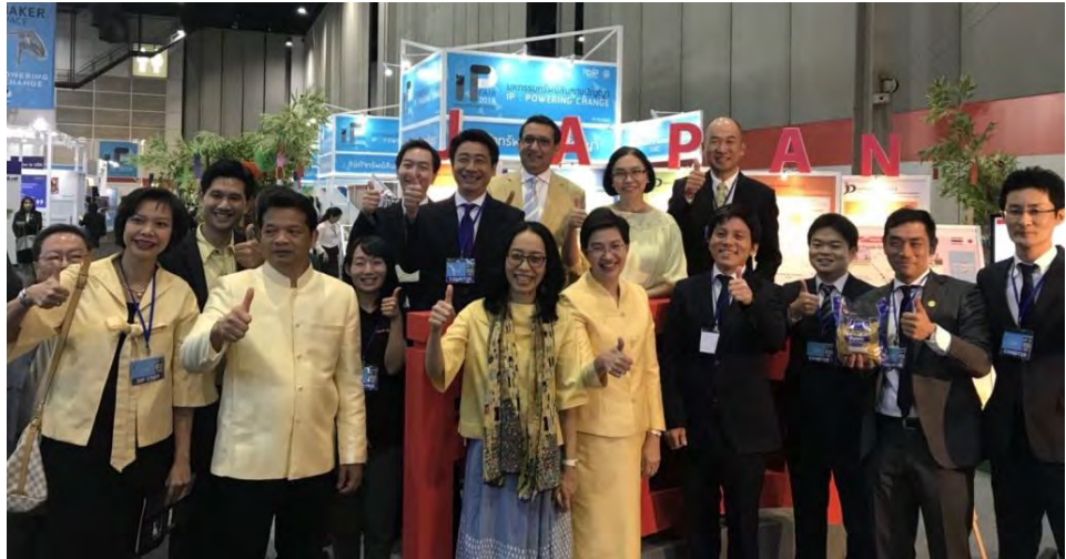
DIP, JETRO, Thai Nisshin seifun